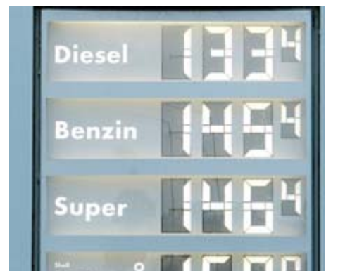
95,9 Cent für einen Liter Diesel – das war einmal, derzeit liegen die Preise um 1,33 Euro.