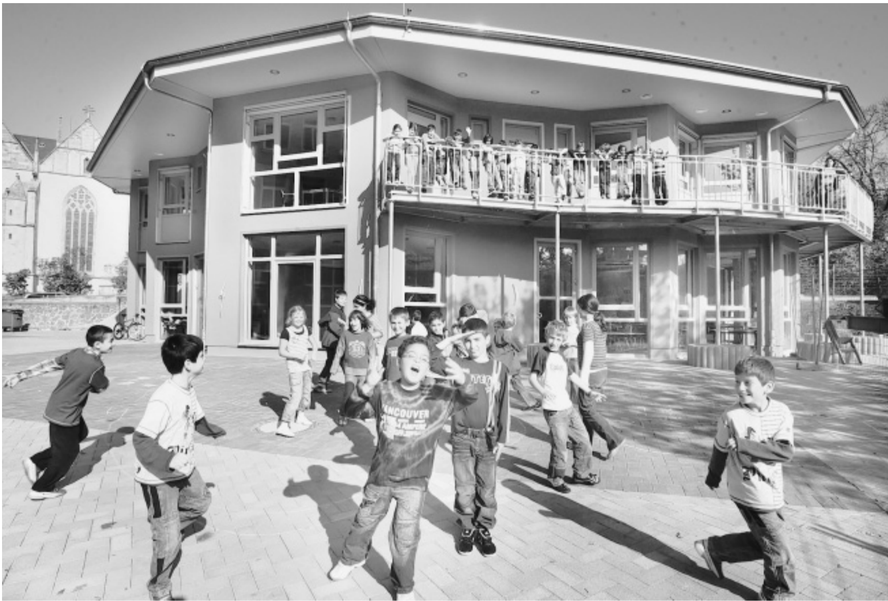
Grundriss mit vielen Ecken: Schulbau an der Herforder Grundschule Stiftberg. Unten sind Mensa und Gruppenräume eingerichtet, in der oberen Etage befinden sich vier Klassenräume. Erst seit wenigen Tagen wird hier gelernt.

In einem kompletten Schulneubau konnten seine Ideen nicht überprüft werden: Neue Schulen werden angesichts zurückgehender Schülerzahlen in Deutschland kaum noch ge-